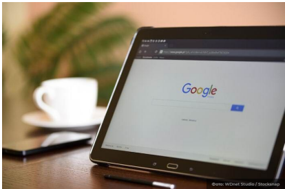
Google сломал собственное облако, но чинить его не торопится

У Yeonjoong, по его словам, удалились не все файлы, а лишь те, что были загружены с мая по ноябрь 2023 г. Что еще более интересно, на его облачное хранилище словно была развернута старая резервная копия – даже структура папок вернулась к такому же виду, в каком она была в мае 2023 г.